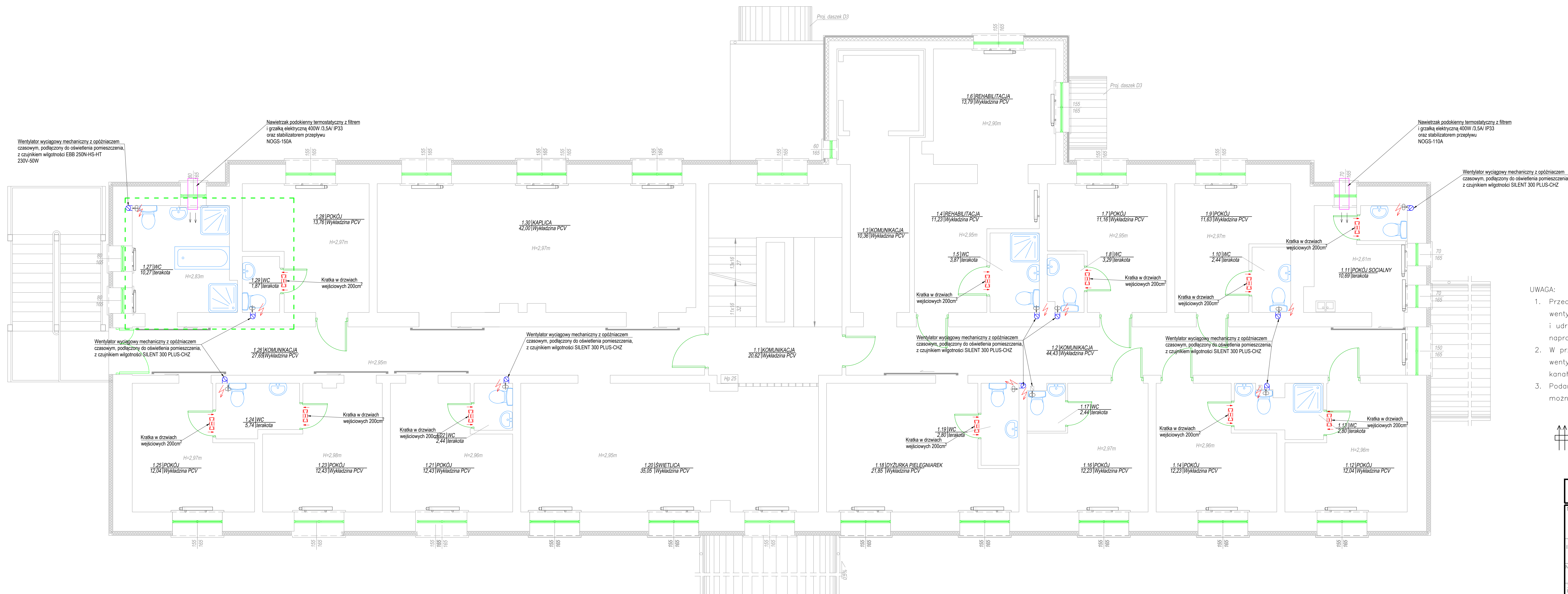
Schemat nr. 1: Montaż nawietrzaka podokiennego